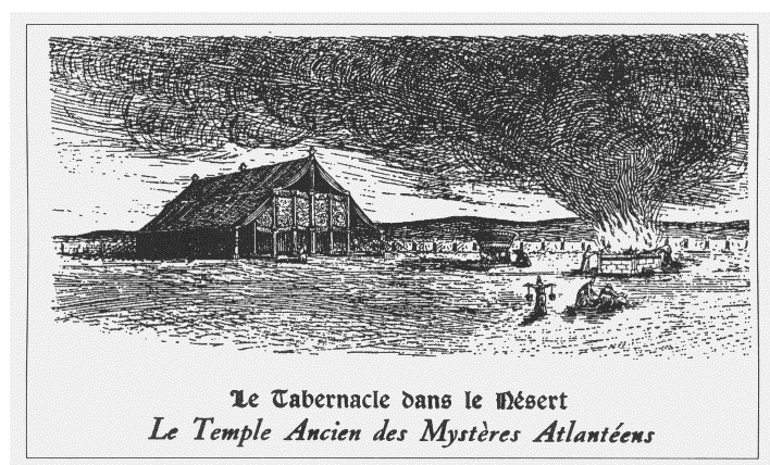
Diagrama - El tabernáculo en el desierto